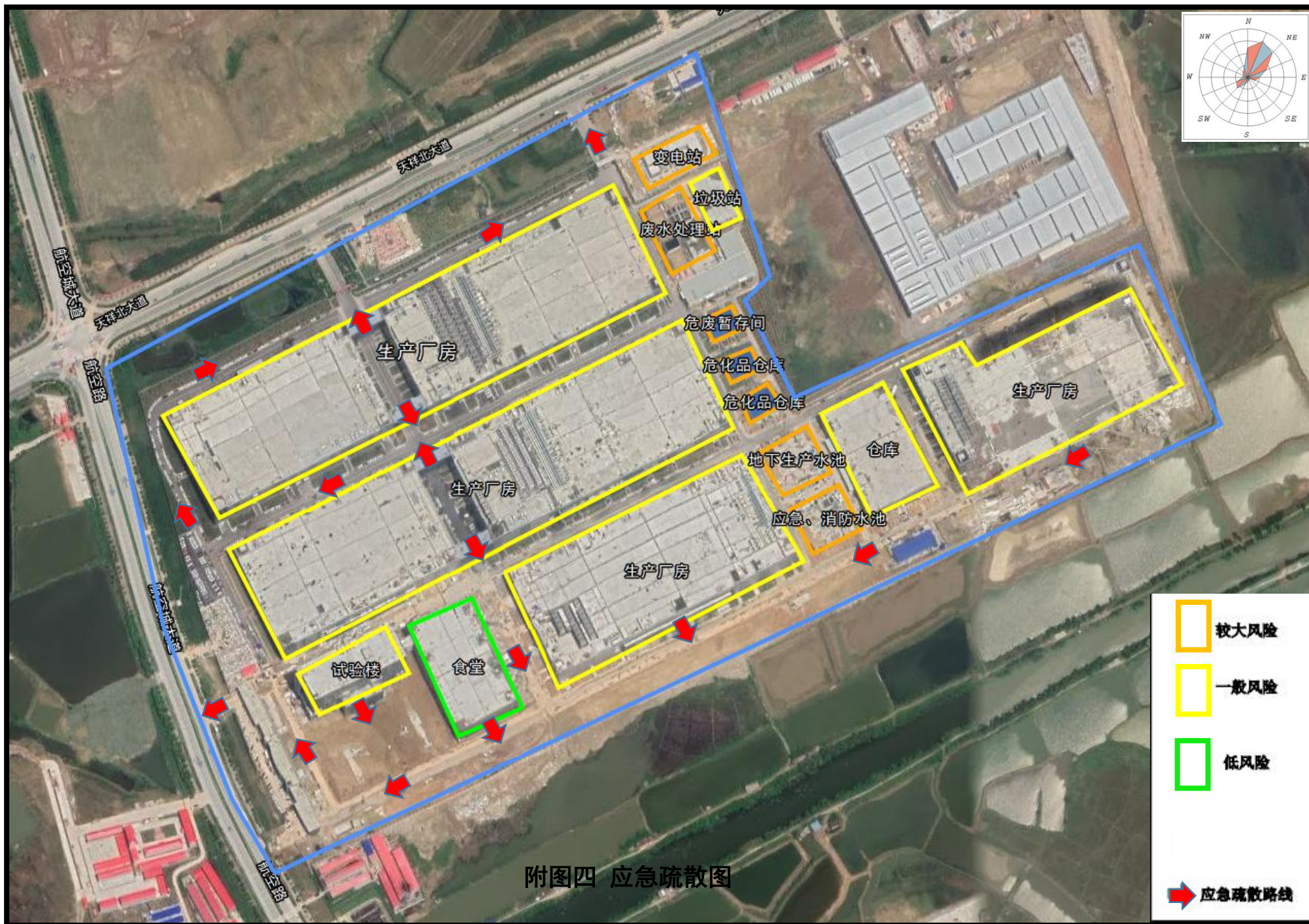
附图四 应急疏散图